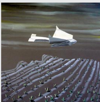
Boegön, still life, huile toile sur bois, 2011