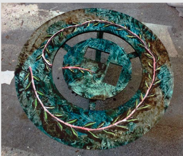
Table/soudure, peinture, vernis/ 2014