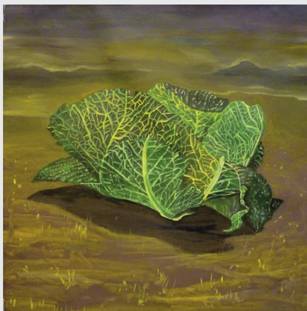
Coliflor, huile toile sur bois, 2011